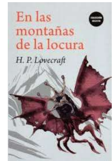
Lovecraft, H.P. (2019). En las montañas de la locura . Edit. Biblok, 296 págs.

Como toda su obra, este texto es un reflejo de sus oscuras fantasías convertidas en novelas y cuentos, que se encuadran en su ciclo de historias tétricas denominado Los mitos de Cthulhu , obras que, si bien se considera no cumplen con los estándares de alta calidad literaria, tienen la cualidad de perdurar en la mente del lector y de hundirlo en esa locura que fue la mente de Lovecraft.👁️