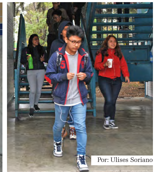
Por: Ulises Soriano