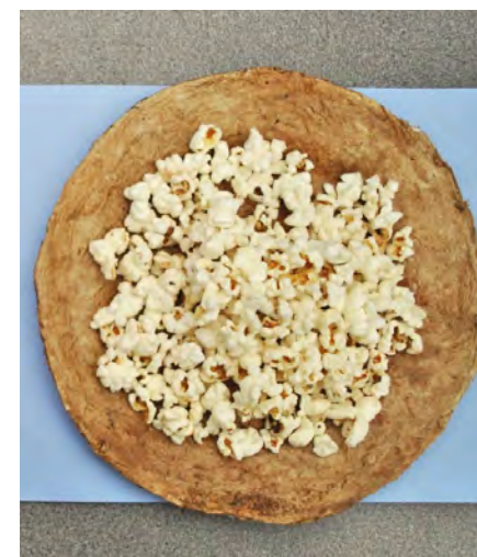
Plato a base de fibra de coco