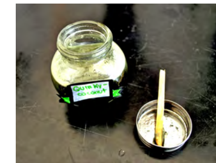
Pasta dental elaborada con aceite de coco y platos fabricados con semillas de lentejas

A través de sus proyectos, los jóvenes universitarios echaron a andar sus habilidades científicas, de investigación, creativas, analíticas e incluso de pensamiento y comunicación, al ser capaces de materializar su imaginación y exponerlo ante un jurado, o bien entre sus compañeros. Además, no solo presentaron productos benéficos y de uso cotidiano, también realizaron investigaciones teóricas sobre la his-