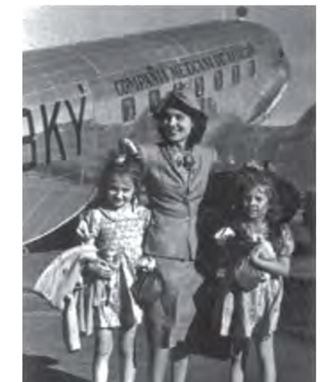
Llegada a México, junto con su madre y hermana, procedente de Cuba