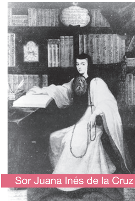
Sor Juana Inés de la Cruz

Además de ser una gran deportista, Paola Longoria (1989) es una mujer bellísima. Posee una maestría en Ciencias Políticas y es Ingeniera Mecánica. Es una de las mejores jugadoras del Racquetball y ha ganado 16 medallas internacionales de oro; 7 veces vencedora del “Us Open” y un sinfín de campeonatos. Rendirse es muy fácil y ella se aferró a sus sueños.