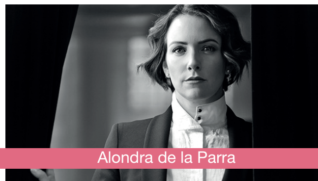
Alondra de la Parra

Una de sus canciones más notables se titula “Júrame”