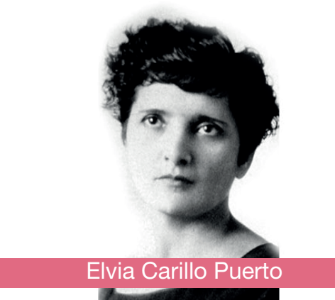
Elvia Carillo Puerto