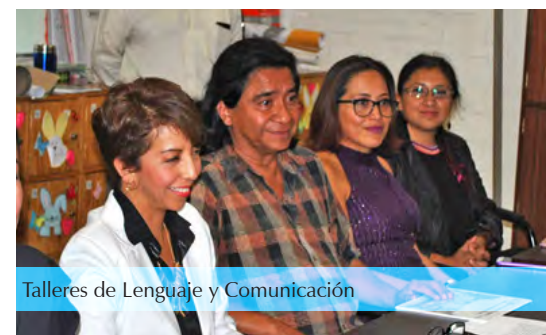
Talleres de Lenguaje y Comunicación

*Los resultados estarán disponibles a finales del mes de octubre, para ello también te contactaremos.