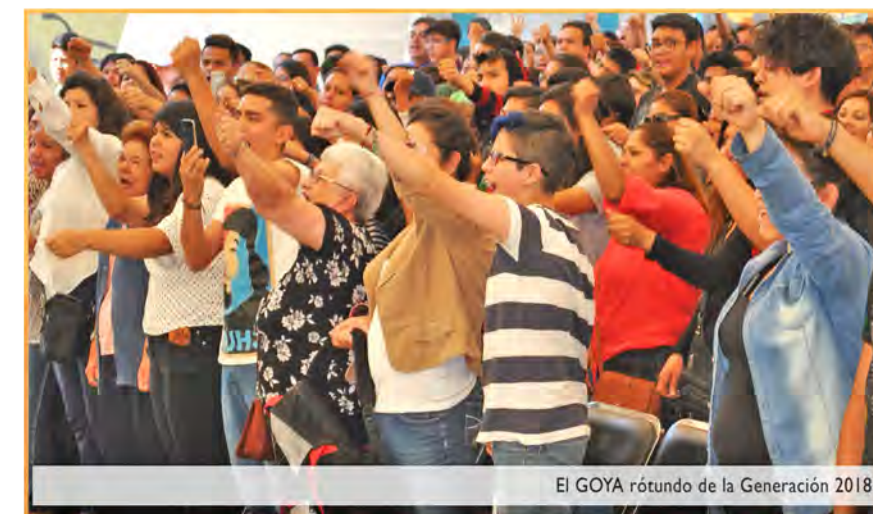
El GOYA rötundo de la Generación 2018