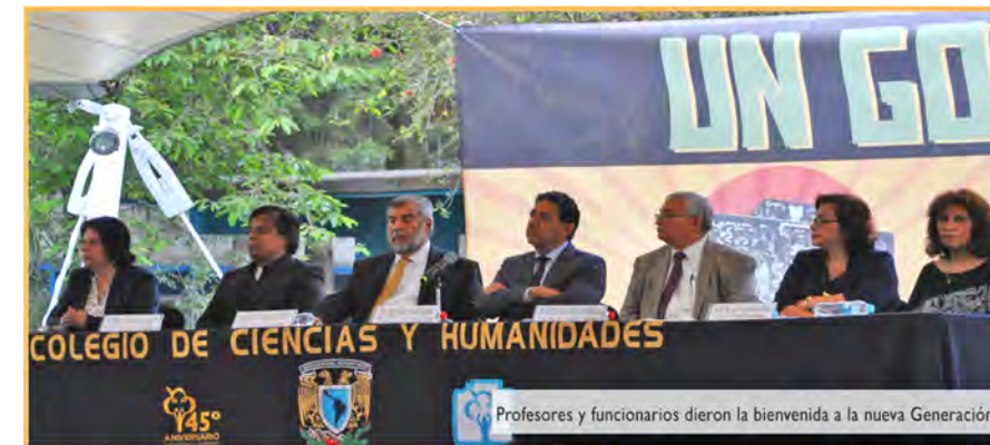
Profesores y funcionarios dieron la bienvenida a la nueva Generación