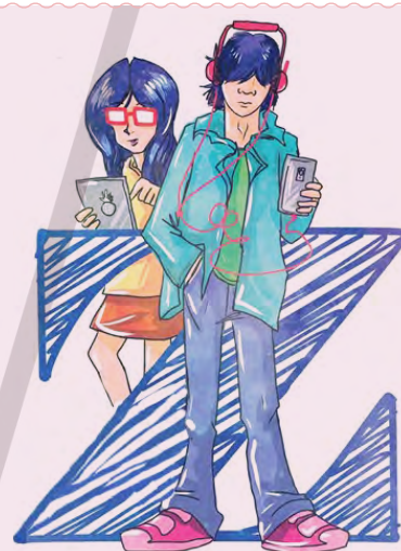
Por: Miguel Ángel Landeros Bobadilla (primera parte)