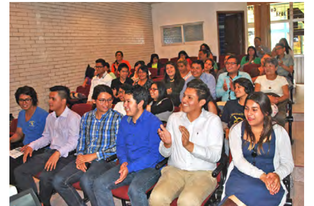
La inolvidable experiencia de ser joven asesor

periodo 2015-2016, se creó el club de Historia #cuentameotrahistoria, se abrió el programa a nuevos asesores a través de asesorías muestra, se creó el club de oratoria y se llevó a cabo la jornada de limpieza. Asimismo, se incorporaron asesores en el turno vespertino, se dio seguimiento a la página de Facebook del programa para compartir publicaciones de interés general, así como a los talleres de verano como “Historia exprés sin estrés”, entre otras actividades.