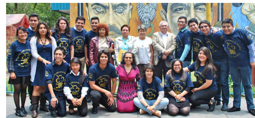
El equipo de jóvenes asesores con el director del plantel

Finalmente, se invitó a aquellos alumnos interesados en apoyar a sus compañeros en sus estudios. Entre los requisitos para participar se debe ser alumno de tercer a sexto semestres, tener promedio mínimo de 8.5, contar con tiempo disponible de tres horas semanales y, sobre todo, mucho entusiasmo. Los interesados pueden acudir al edificio W con su historial académico reciente, carta de exposición de motivos, preparar una pequeña clase muestra de la materia elegida para, de este modo, colaboren en la gratificante experiencia de ser asesor. 📖