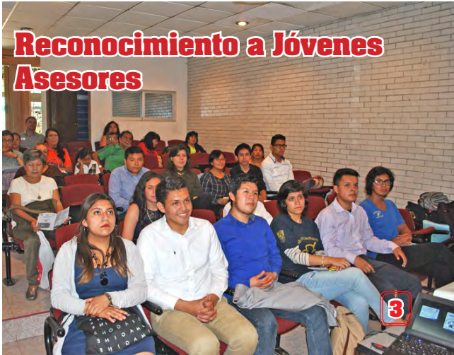
Reconocimiento a Jóvenes Asesores