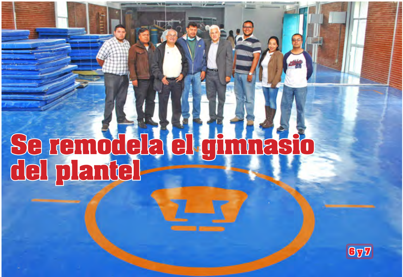
Se remodela el gimnasio del plantel