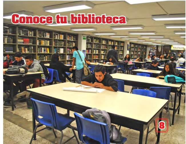
Conoce tu biblioteca