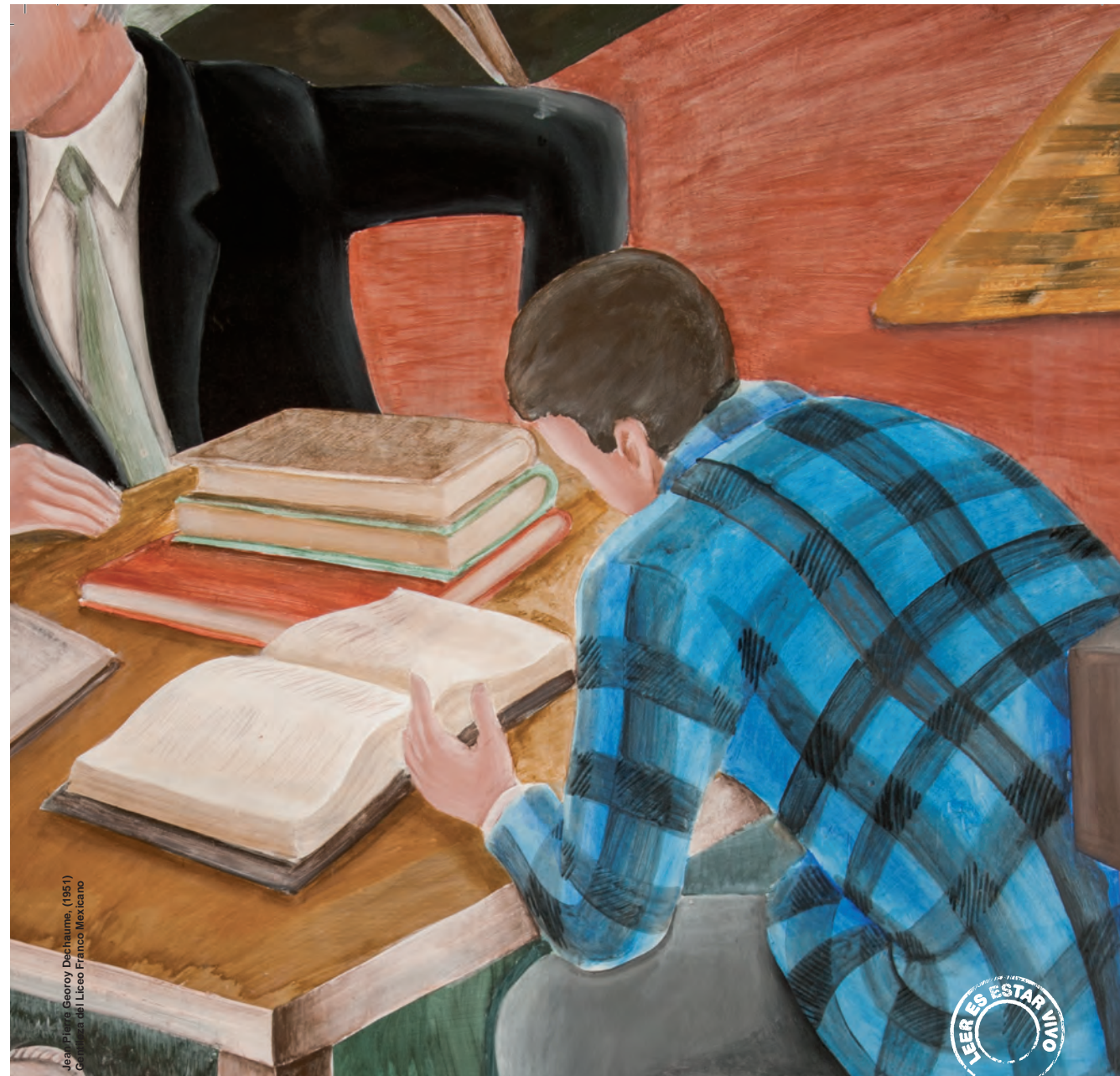
Josep Pla, Georcy Ducharme, (1951) Cuentos del Libro Franco Mexicano