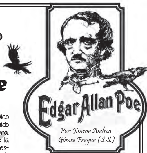
Por: Jimena Andrea Gómez Fragua (S.S.)

El 19 de enero de 1809 llegó al mundo Edgar Allan Poe, poseedor de una inquietante imaginación que dio vida a más de 60 narraciones extraordinarias, cuentos de lo grotesco y sublimes poemas que han estremecido a decenas de generaciones que encuentran entre sus letras las más puras manifestaciones de fuerza, viveza y sombría pasión.