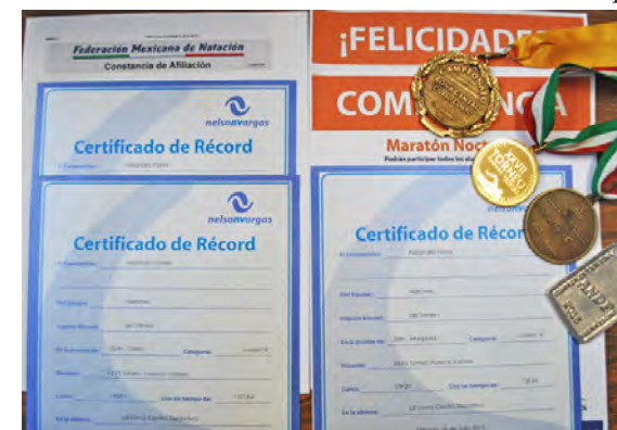
Reconocimientos a la constancia y disciplina

les dé poca difusión, a pesar de los éxitos obtenidos por varios atletas en clavados en distintas competencias mundiales. Por ello, invitó a los jóvenes cecechacheros que se acerquen al deporte en general y específicamente a la natación, pues es una actividad que ayuda a conservar la salud, permite hacer amistades y a fomentar la disciplina, así como no abandonar sus estudios, pues deporte y educación son garantía de éxito.