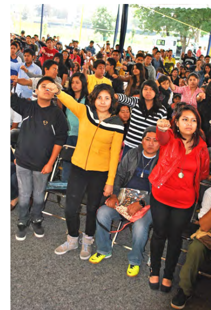
Protesta del juramento universitario