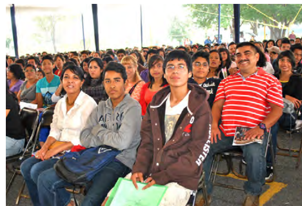
Festejo compartido por alumnos y padres de familia

personal y social. En suma, como lo señala también el propio rector, “la educación es el pase a la posibilidad de soñar, imaginar un mundo mejor;... con la educación podemos construir las verdaderas utopías y transformar las dolorosas realidades que acompañan a nuestras sociedades”.