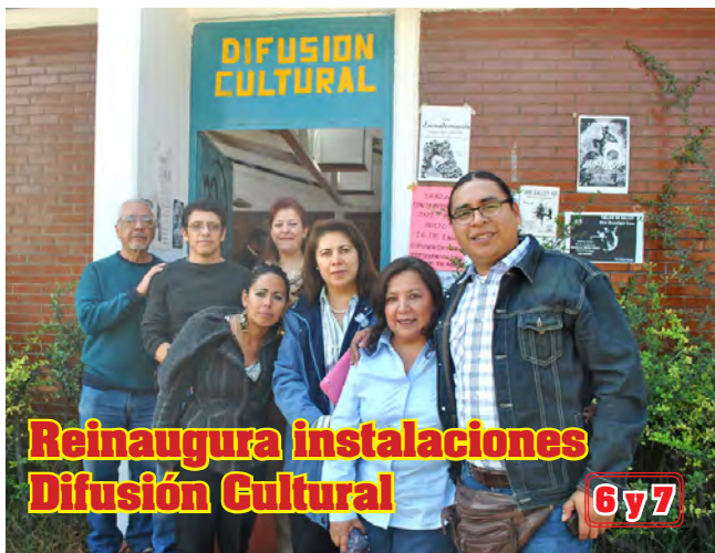
Reinaugura instalaciones Difusión Cultural