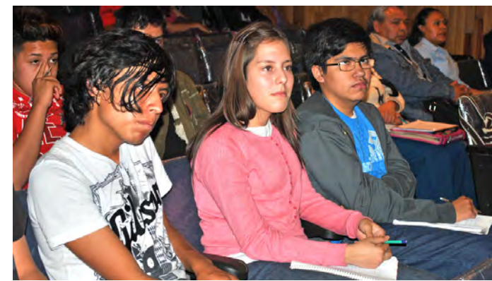
El inicio de los nuevos investigadores y científicos