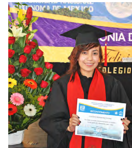
El cumplimiento de una meta

Finalmente, destacaron que la generación que egresó fue única e irrepetible, pues cada uno puso de sí mismo para