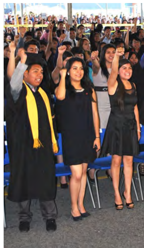
El último goya cecechachero

“Ésta es tu casa, ésta es la Universidad”