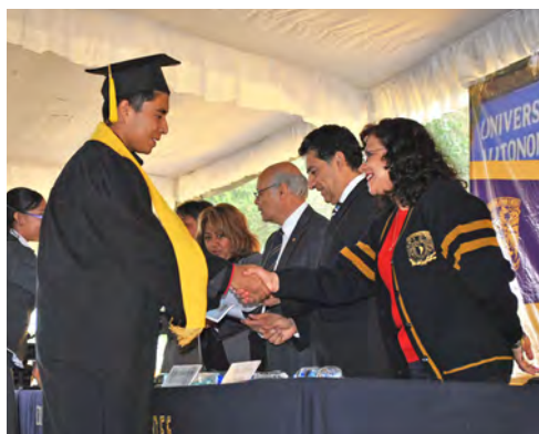
Reconocimiento al esfuerzo constante y sostenido