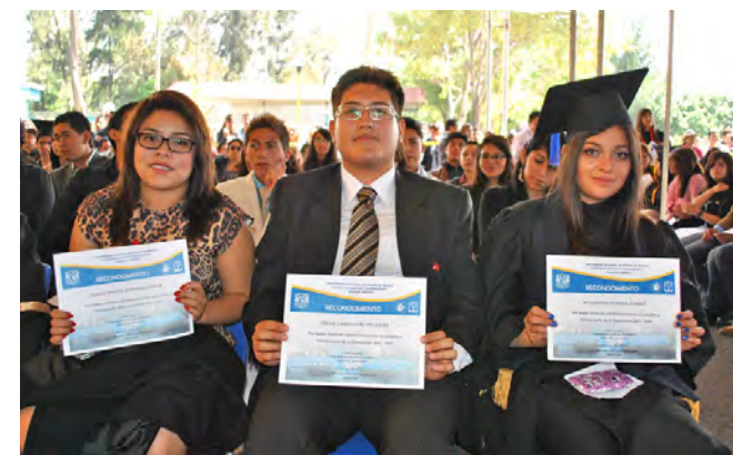
Emotiva ceremonia de Egreso de los ahora ex-cecehacheros