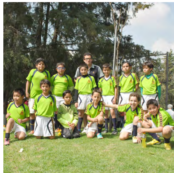
“La esperanza verde en Pumitas”

Así, el “orgullo deportivo estará en juego” y quizá el nacionalismo o patriotismo desmedido, pero también la indiferencia por nuestra problemática nacional; por la pobreza, la delincuencia, por las malas políticas gubernamentales y locales; por la falta de