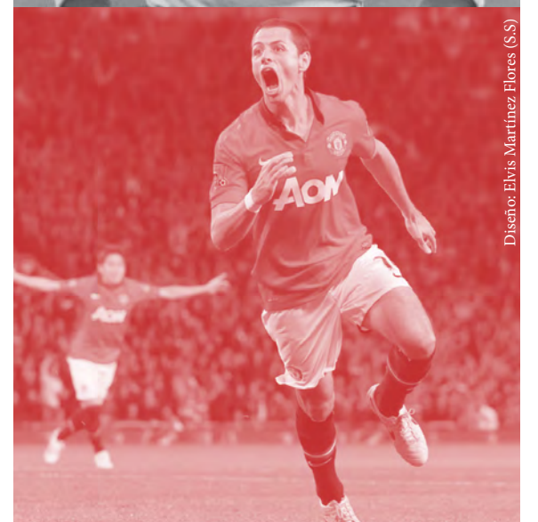
Diseño: Elvis Martínez Flores (S.S)

la “línea dorada” del Sistema de Transporte Colectivo Metro; por el desmedido consumo de bebidas que aligerarán el triunfo, la derrota, o el empate.