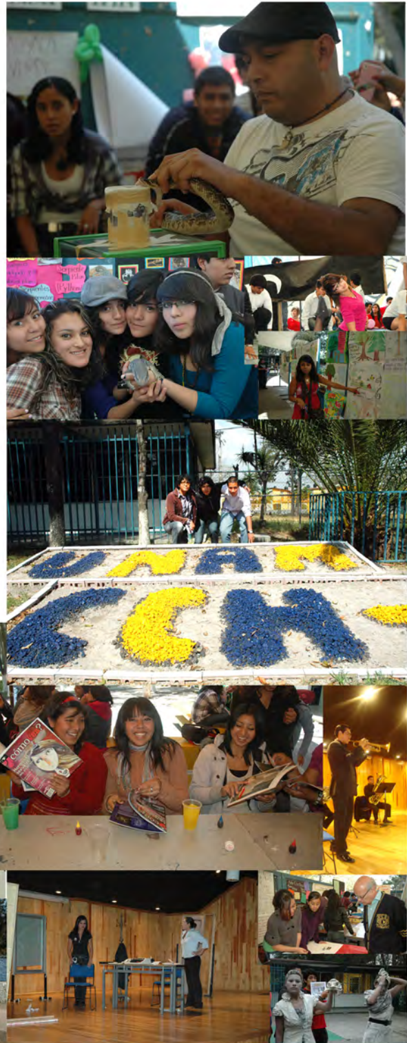
Diseño Abigail Mejía Cortés

Tampoco debemos dejar de hacer mención al fomento de la difusión de la cultura e identidad universitarias, que la Dirección General de Colegio y el Departamento de Difusión Cultural promueven permanentemente para los aportes y beneficio de la cultura en la formación integral de los jóvenes. A un año de logros y, por supuesto, pendientes por cumplir, reiteramos que como Dirección es necesaria la visión y participación plural e incluyente en los aspectos académicos, estudiantiles y administrativos, que den como resultados consensos y propuestas favorables al fortalecimiento de este centro educativo, hoy en día uno de los mejores del bachillerato de la Universidad Nacional.