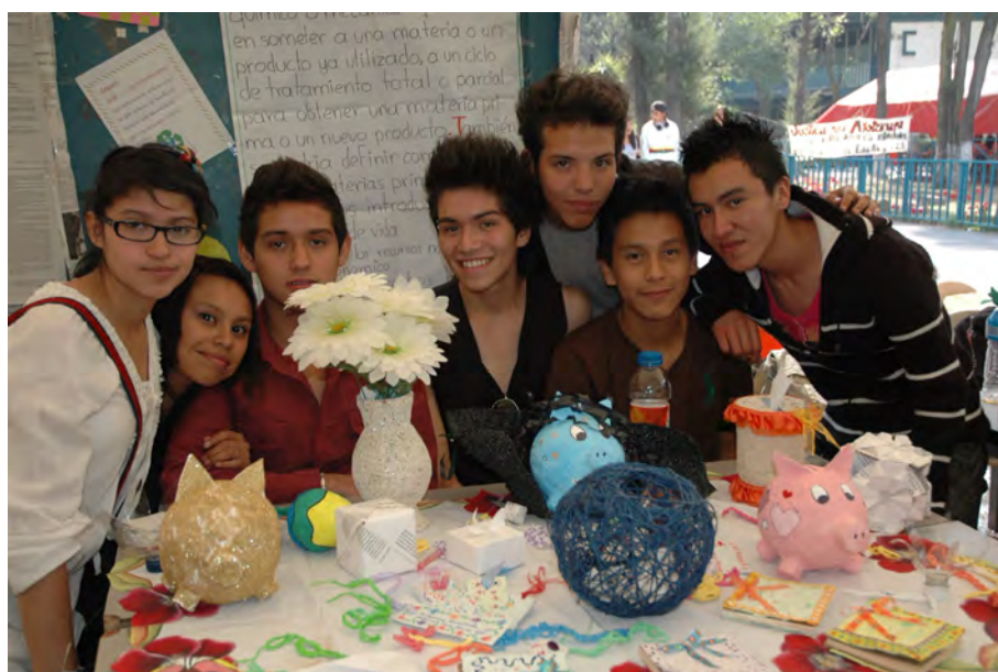
Diseño: Abigail Mejía Cortés

La responsabilidad personal es una virtud que debe aplicarse a los pensamientos, sentimientos y acciones de un estudiante. En última instancia, con suficientes recursos disponibles, el tiempo y el esfuerzo que dedique la persona a cultivar éste tan olvidado valor de la responsabilidad, que determinará su grado de éxito.